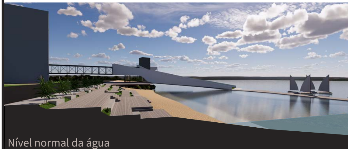
Nível normal da água

Em vista do lago formado pelo represamento do ribeirão próximo ao Villa Flora, infere-se que tanto a prainha quanto o píer foram projetados de modo a permitir o uso em diferentes contextos de variação do nível da água. Assim, a exemplo dos cortes abaixo, nota-se que a disposição dos patamares garante sempre um espaço aos usuários, enquanto que a estruturação flutuante do píer e a rampa articulada que o conecta à rua garantem o acesso praticamente constante aos barcos.